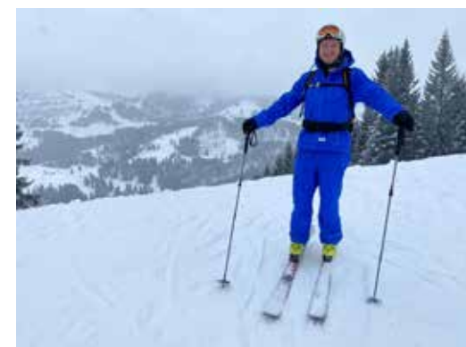
Das Lehrteam freut sich darauf, kommende Saison das neue Gewand einzufahren.