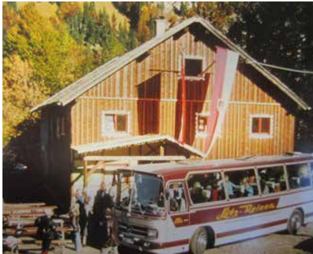
Das Hüttenfest brachte jedes Jahr viele kressbronner Gäste zur Messe auf die Kressbronner Hütte.

Unvergessen bleiben für uns unfassbar viele gemütliche und lustige Abende – im Sommer am Lagerfeuer und im Winter bei gefühlt über 30 Grad in der Stube, weil zu viel Holz in den Ofen nachgelegt wurde.