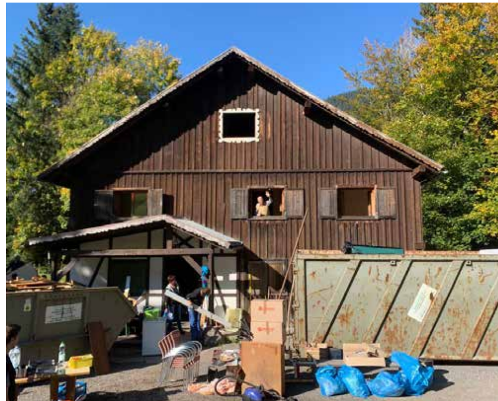
Günter Stöckl beim Abbruch der Hütte, die er schon mit aufgebaut hat.